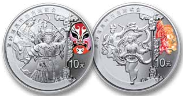
Moeda de Prata da Ópera de Beijing (Pequim)