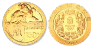
Moeda de Ouro de Luta-Livre