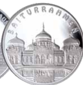
Moeda de Prata Baiturrahman