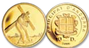
Moeda de Ouro da Crucificação