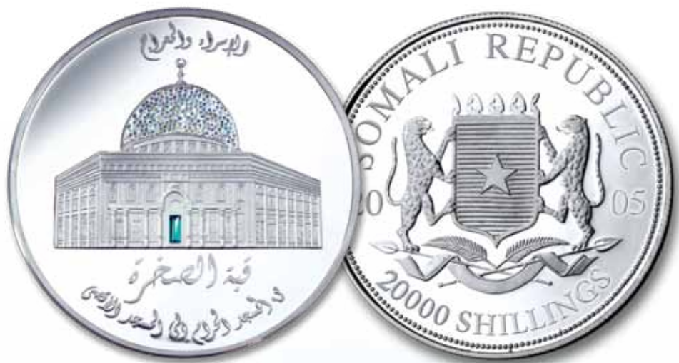
Dome of the Rock with Crystal Coin