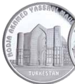
Moeda de Prata do Turquistão