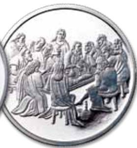
Moeda de Prata da Santa Ceia