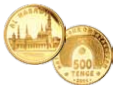
Moeda de Ouro Al Masjid Al-Nabawi