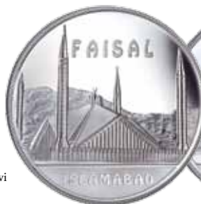
Moeda de Prata Shah Faisal Masjid