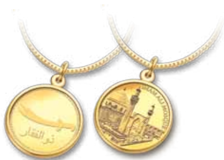
Pingente Mesquita Imam Ali