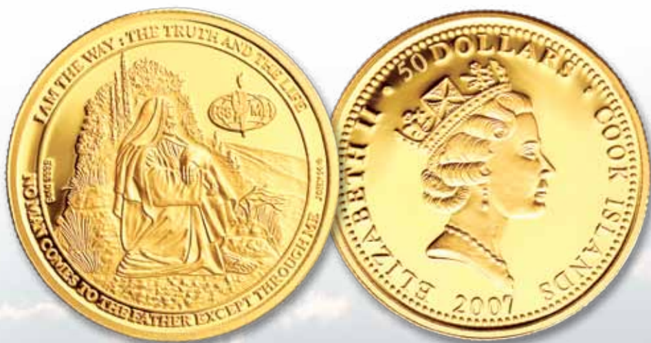
I am the Way Commemorative Coin