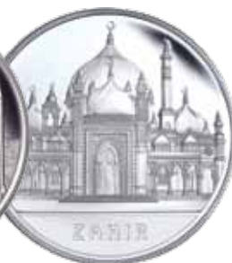
Moeda de Prata Mesquita Zahir