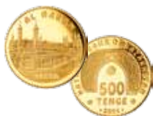
Moeda de Ouro Al-Haram