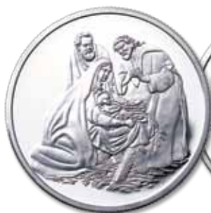
Moeda de Prata do Nascimento de Jesus Cristo