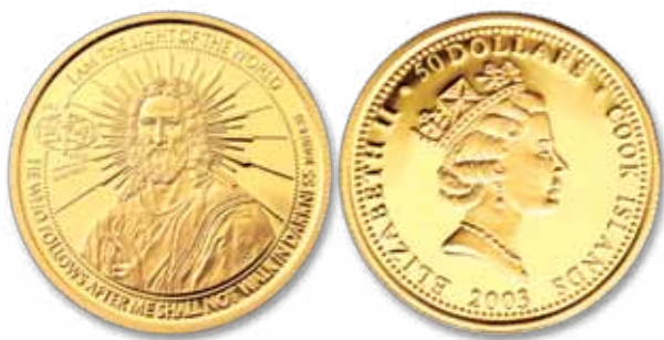
Light of the World Commemorative Coin